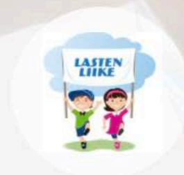
LASTEN LIIKE KERHOPALVELU