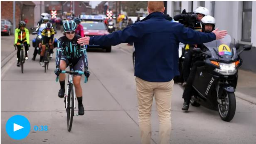
▲ Women's cycling race 'neutralised' as lead rider catches men's race – video

A cycling race in Belgium was thrown into disarray when the leader of the women's race, which set off 10 minutes after the men's, almost caught up with her male counterparts and found herself in danger of being impeded by their support vehicles.